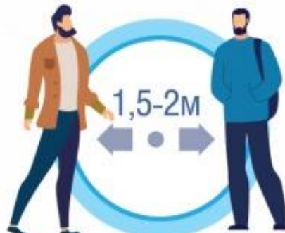
СОБЛЮДАЙТЕ РАССТОЯНИЕ И ЭТИКЕТ